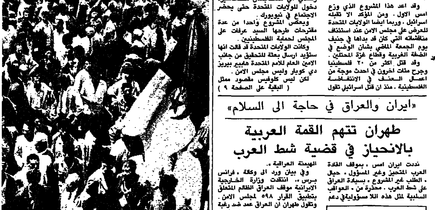
طليعة السيرة (رويترز) ومعظم وسائل الاعلام، الجزائر - ر

نظم عشرات الافراد من مؤيدي الزعيم الجزائري المعارض حسين ايت احمد، مسيرة في وسط العاصمة الجزائرية امس، لاستكروا خلالها اول انتخابات حرة في الجزائر، والتي من المقرر ان تجري الشهر المقبل ووصفوها بأنها مؤذنة. وكان معظم المظاهرات من البربر الذين يساندون حزب، جبهة القوى الاشتراكية، الذي يزعّمه السيد ايت احمد، احد اطال حرب التحرير التي انتهت باستقلال الجزائر عن فرنسا عام ١٩٦٢. وقد علم السيد ايت احمد (٦٣ عاما) ان البلاد من المنفي في كانون الاول الماضي وانخرط في النظام الديمقراطي متعدد الاحزاب المنقذ في الجزائر. واستنكر السيد ايت احمد الانتخابات المقرر اجراؤها في ١٢ حزيران لانتخاب المجلس البلدية ومجلس الولايات، ووصفها بانها مؤذنة، وطالب بمقاطعتها بحجة ان حزب جبهة التحرير الوطني، الحاكم لعام ١٩٧٢، لا يزال يسيطر على البرلمان والحكومة